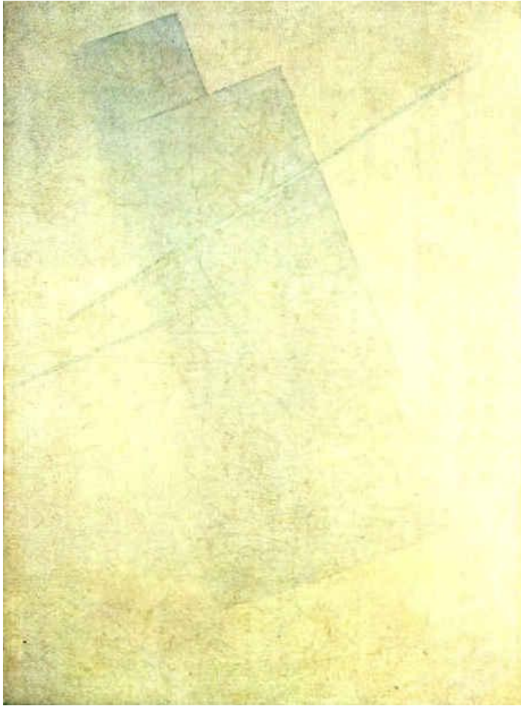
Figure 3 : Kasimir Malevitch, Suprématisme