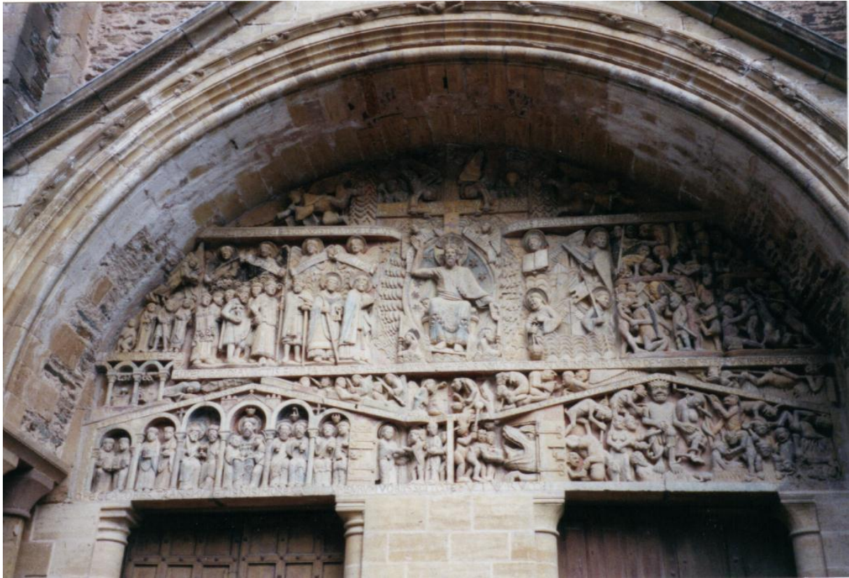
Figure 1 : Tympan du portail de l'église de Conques, XIe siècle.