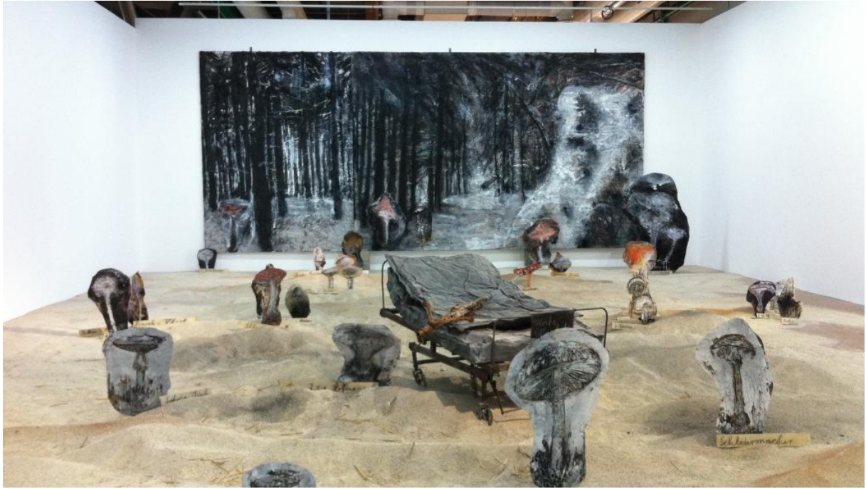
Figure 5 : « Pour Madame de Staël : de l'Allemagne », 2015, Installation in situ sous les tuyaux du Centre Pompidou-Paris. Vue de l'œuvre dans la rétrospective Anselm Kiefer.