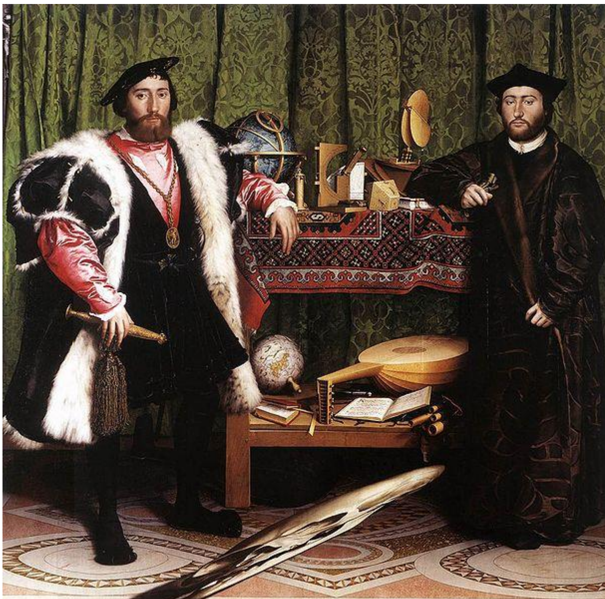
Figure 2 : Hans Holbein le Jeune, Les Ambassadeurs (Jean de Dinteville et Georges de Selve) , 1533. Huile sur panneau de bois, 209 × 207 cm. Londres, National Gallery