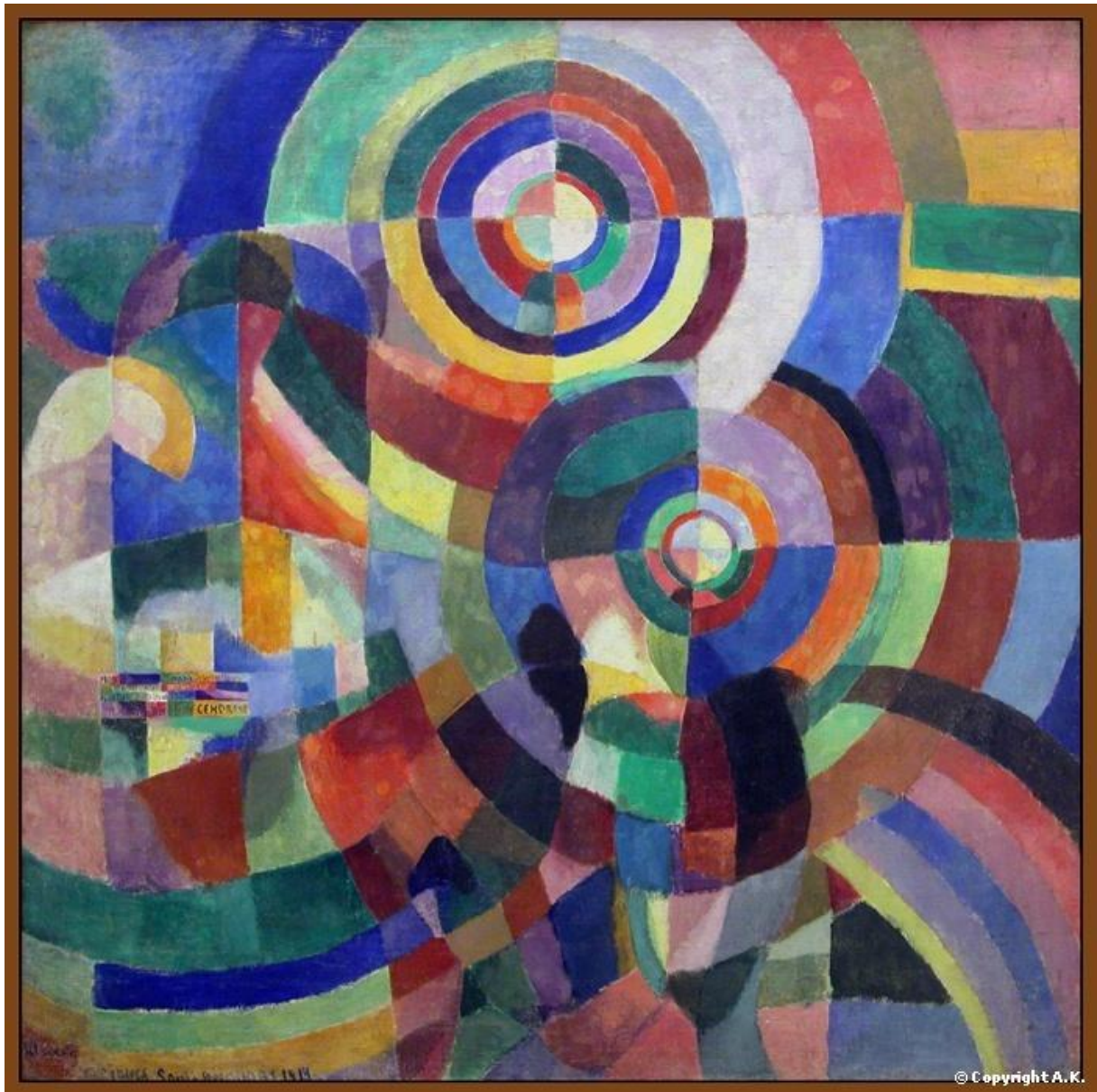
Figure 4: Sonia Trek-Delaunay, Prismes électriques , 1914, huile sur toile, 250 x 250 cm Paris, MNAM, Centre Georges Pompidou