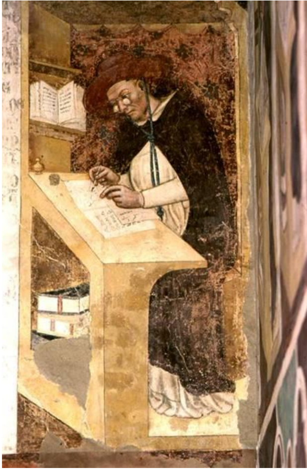
Figure 1 : Tommaso da Modena, Nicolas de Rouen , chapitre du couvent de l'église San Nicolò, Trévis, v. 1352