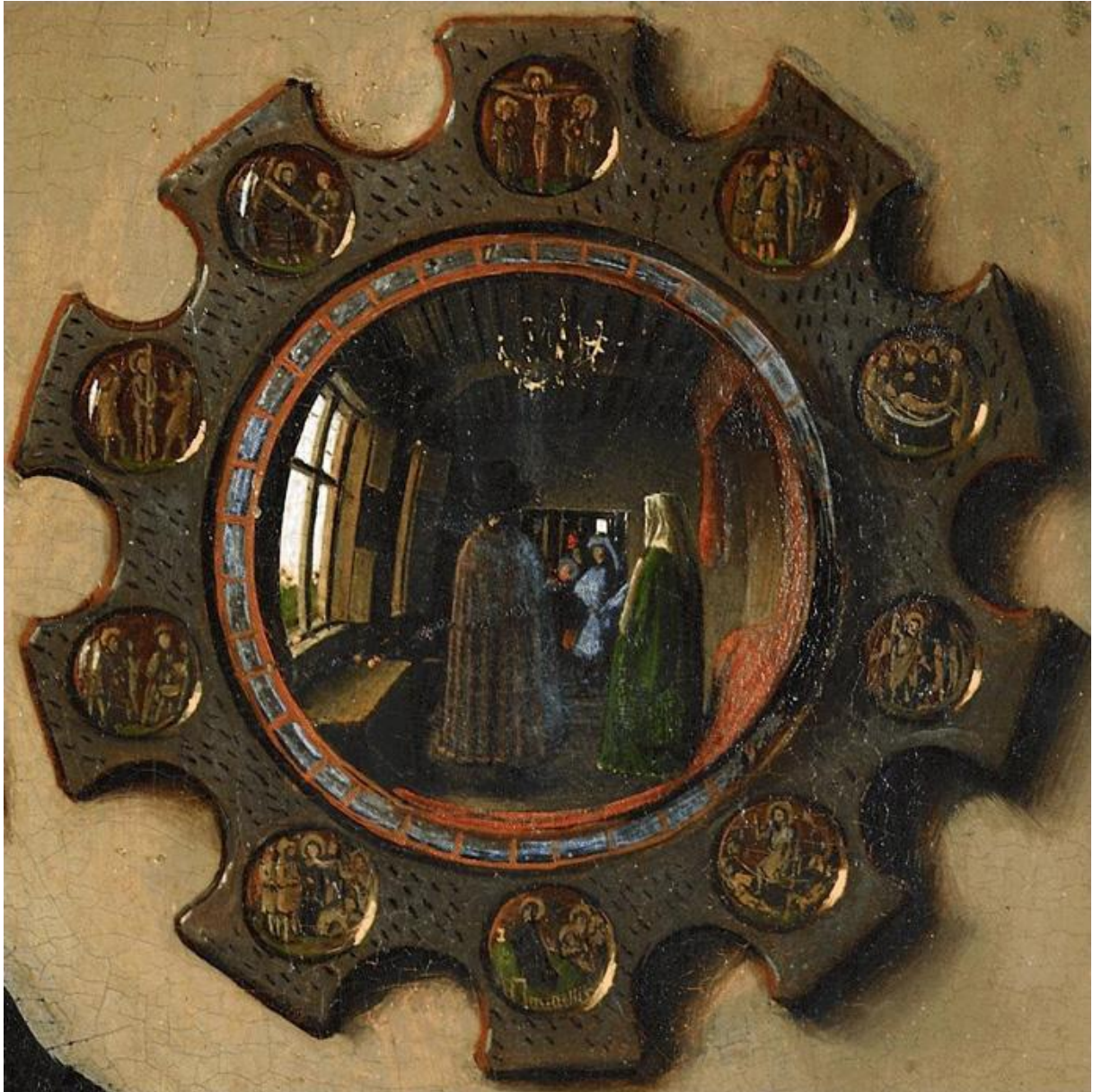
Figure 2 : Jan Van Eyck, Les Epoux Arnolfini , 1434, National Gallery, Londres