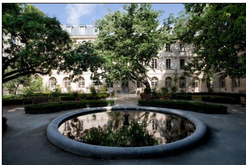
La Cour aux Ernest de l'École normale supérieure.