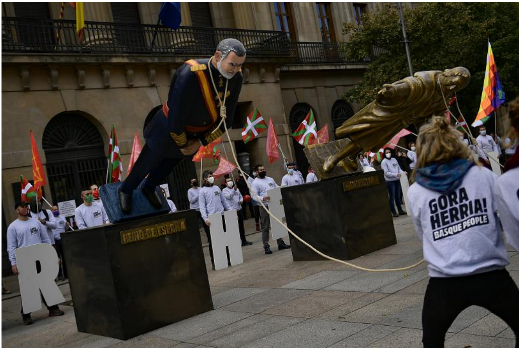
Manifestación ante el Gobierno de Navarra en el Día de la Hispanidad, 12-X-2020