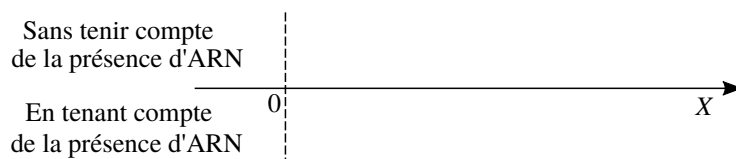
FIGURE 2 – Domaines de formation des virus, selon la valeur du paramètre X = \kappa/\kappa^* (graphe à reproduire et compléter).

Remarque : Puisque X \propto (c_\infty/T)^{1/2} , la condition de formation des virus porte directement sur la concentration ionique et la température.