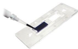
Lame de comptage Malassez ( https://fr.vwr.com )