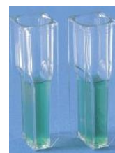
Semi micro-cuve ( www.fr.vwr.com )

Cette année encore, les élèves ont été pour la plupart très calmes et très posé-e-s et ont bien pris soin de lire les deux sujets avant de commencer les manipulations. Malgré cette précaution, nombreux sont ceux qui ont mal géré leur temps : mauvaise prise en charge des temps d'attente liés aux manipulations, attitude trop passive. Cette épreuve exige de savoir doser calme et efficacité. (Cette année encore des parties de manipulation n'ont pas été montrées alors qu'elles avaient été réalisées par les candidat-e-s )