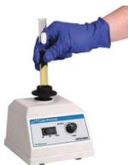
Agitateur vortex ( www.fishersci.fr )